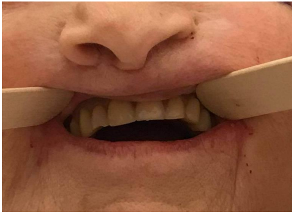
Prothèse en bouche le soir même @serviceCMF-CHUAmiensPicardie