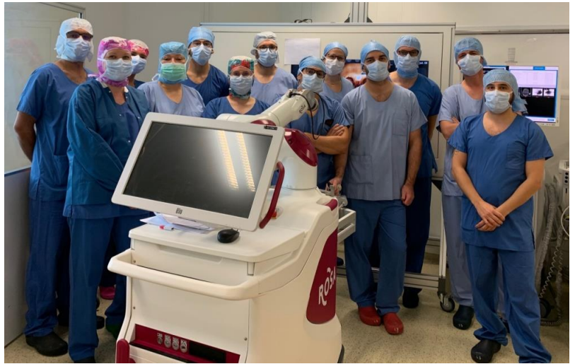
Equipe de chirurgie maxillo-faciale au bloc opératoire après la mise en place des implants sous assistance robotisée